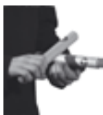
Claves/ rytmepinner lagd av tre.

Claves har en kort og hul lyd. Se om du kan finne noe hjemme som har den samme lyden. Ta det med til neste time og spill øvelse 12a for treneren din.